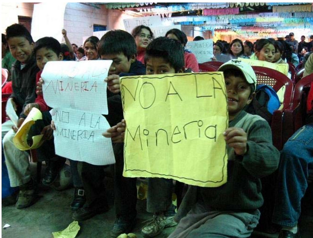
Consulta comunitaria en Ixchiguán, San Marcos, celebrara el 13 de junio de 2007

No obstante, la población de San Marcos se ha dado cuenta de los impactos negativos que trae la actividad minera y ya no se dejará engañar tan fácilmente. Destaca la resistencia pacífica a través de las consultas comunitarias en que miles de marquenses, adultos y jóvenes, han expresado su rechazo a la minería de metales, al igual su apoyo a proyectos de desarrollo sostenible.